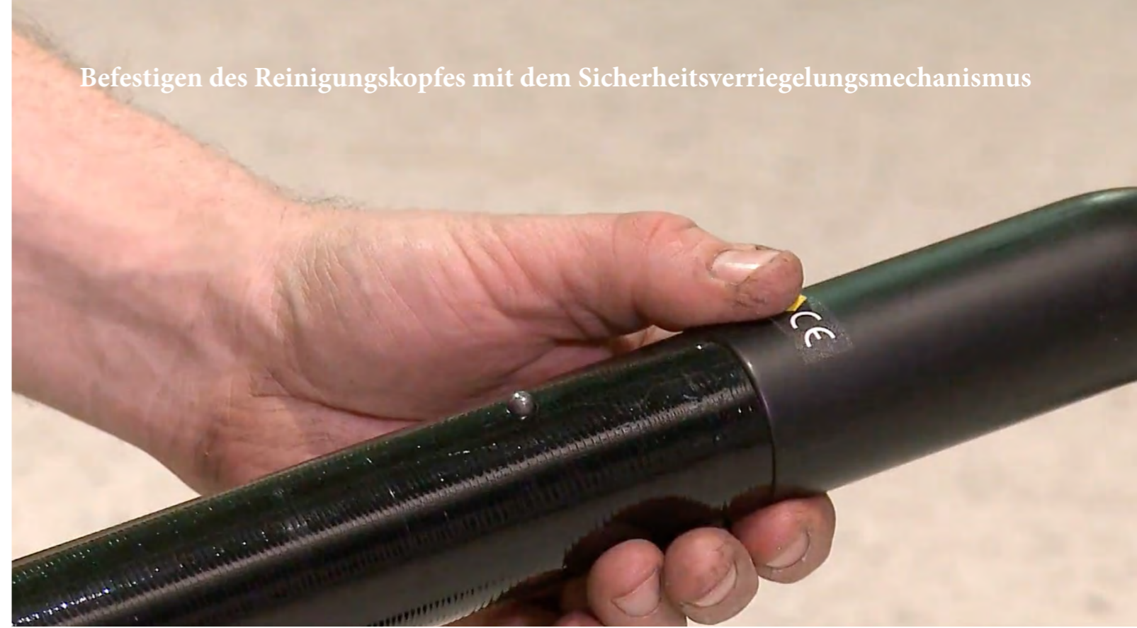
Befestigen des Reinigungskopfes mit dem Sicherheitsverriegelungsmechanismus