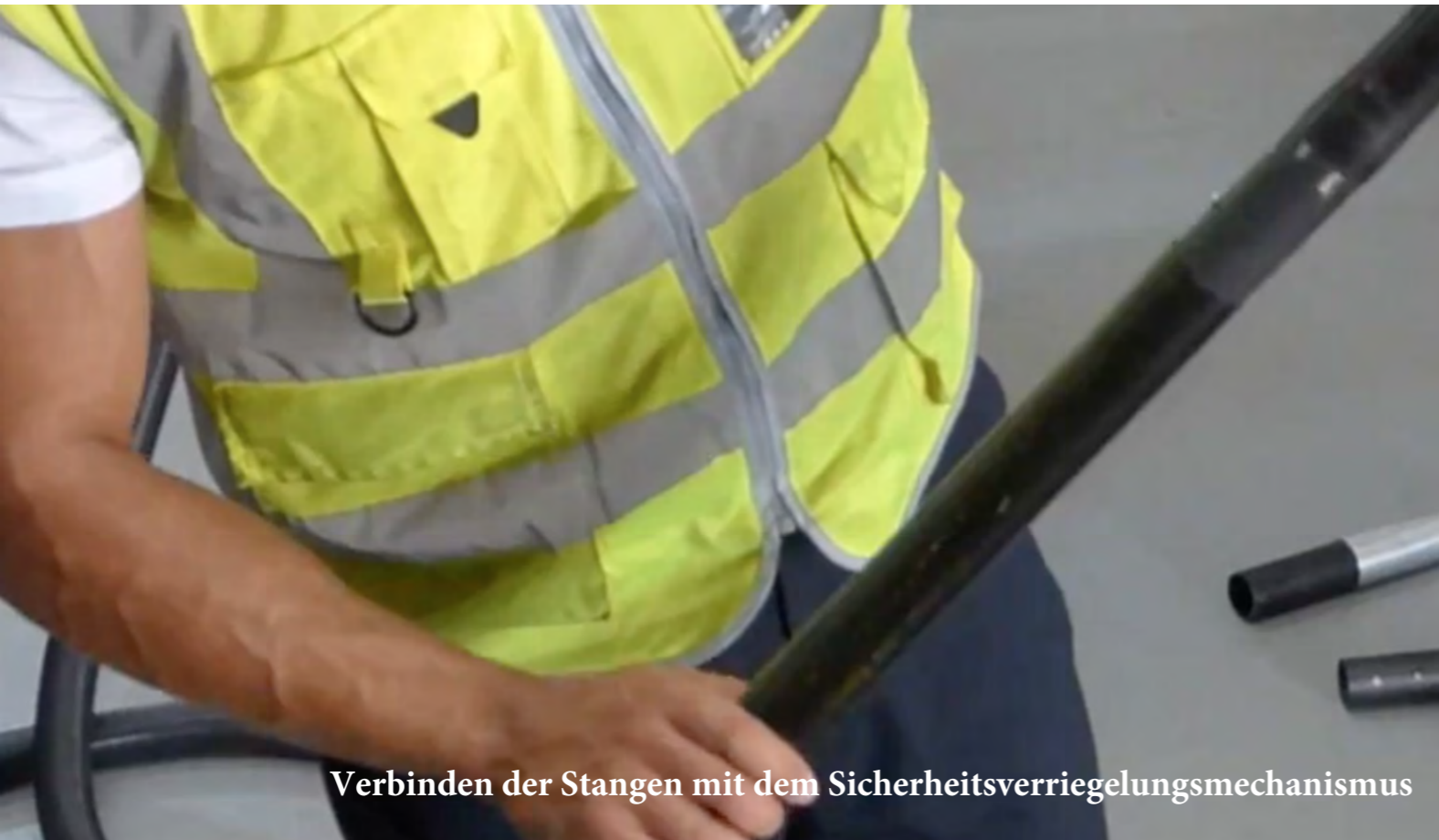
Verbinden der Stangen mit dem Sicherheitsverriegelungsmechanismus