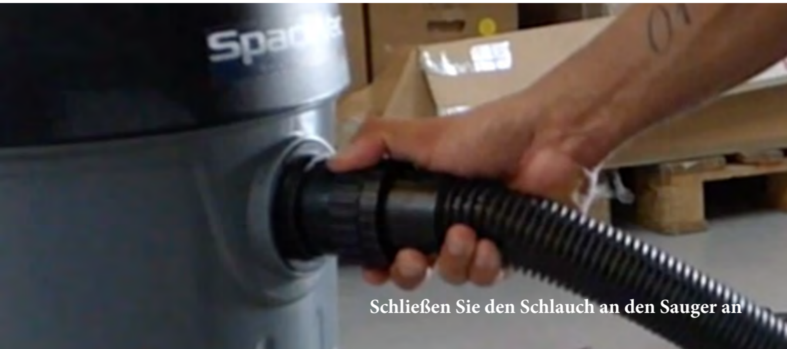
Schließen Sie den Schlauch an den Sauger an